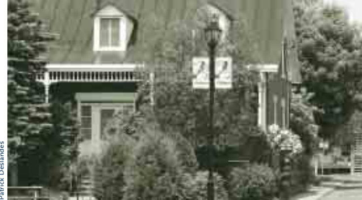
Maison Emma-Trudeau, rue Guertin